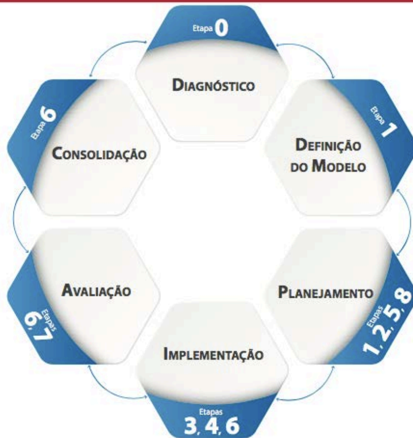
Figura 4.2